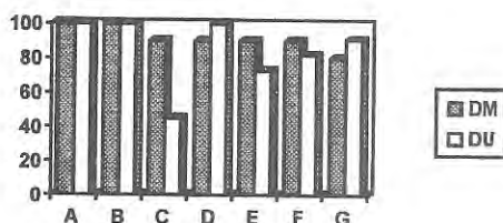
Figura 2. Factores que influyen en la lectura